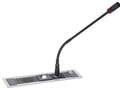
Anwendungsbeispiel Power Frame silver-grey

Wahlweise mit RFID-Kartenleser zur Registrierung und Identifizierung der Konferenzteilnehmer Artikel-Nr.: 05.1235.32