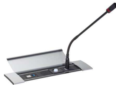
Anwendungsbeispiel Power Frame Cover Aluminium

Rahmen und Abdeckung sind in verschiedenen Farben erhältlich.